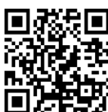
Scan deze QR code voor een 360graden FOTO